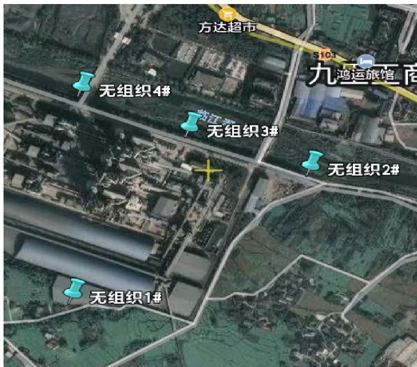
附 4: 一厂废气(无组织)测点示意图